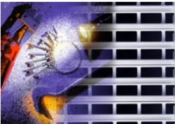
Alusafe er testet i henhold til kommende EU-krav, ENV-1627. Testrapport fås på forespørsel.