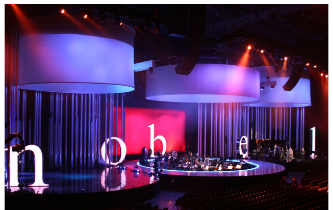
Nobelkonserten: 1,4 km med aluminiumrør MillFinish RAL 9010

Astrup AS har Norges største lagersortiment innen standard aluminiumprofiler. I tillegg leverer Astrup en rekke spesialprofiler, og vi bistår kunder med både rådgivning, utvikling og design av spesialprofiler.