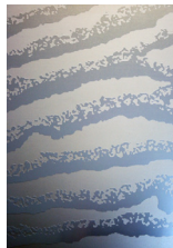
ALUART® Large Dune